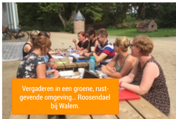
Vergaderen in een groene, rustgevende omgeving... Roosendaal bij Walem.