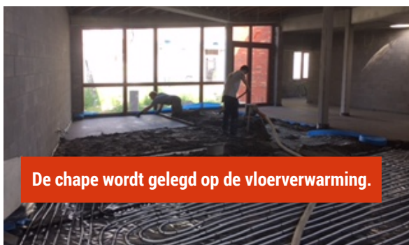
De chape wordt gelegd op de vloerverwarming.

Voor meer info kan je een mailtje sturen naar vol- gende adres: ouderraad@st-pietersschool.be of de leerkrachten of directie aanspreken.