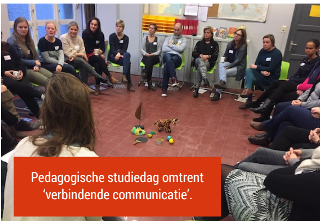
Pedagogische studiedag omtrent 'verbindende communicatie'.

ouderraad@st-pietersschool.be of de leerkrachten of directie aanspreken.